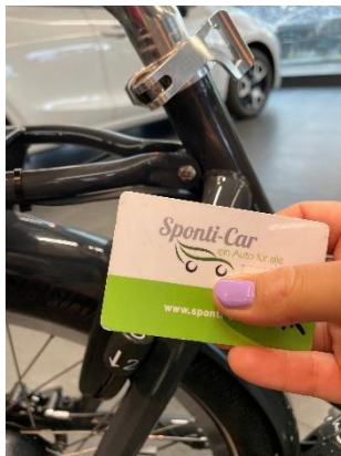
Karte an das Schloss halten