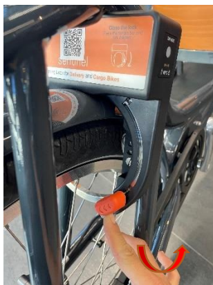
Hebel bis zum Anschlag