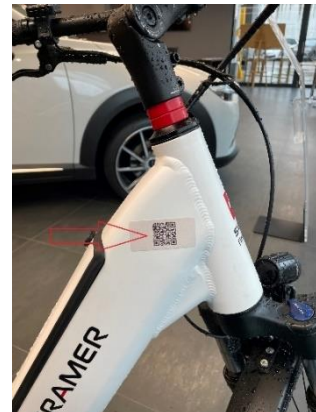
QR-Code scannen Schloss öffnet sich